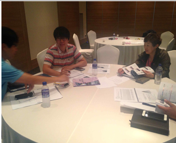
팀 토의 및 서비스디자인 과제수행