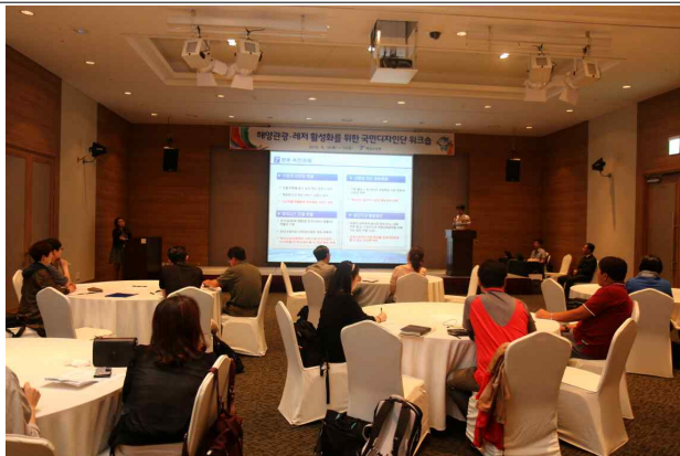
해양관광·레저 활성화를 위한 정보제공 정책 설명