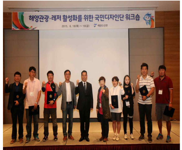
위촉식 단체 사진