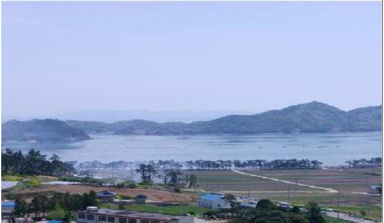
전남 진도 죽림 어촌체험마을 전경