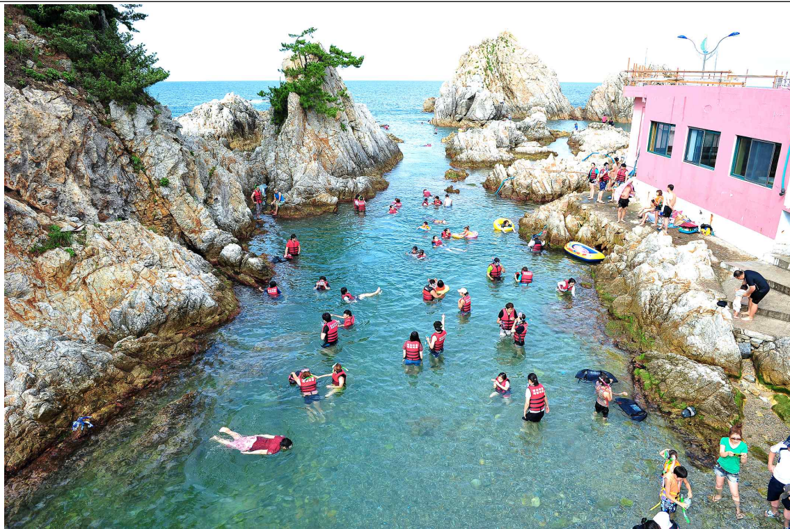
삼척 장호 어촌체험마을 : 바닥이 보이는 오목한 공간에서 스노클링을 즐기는 모습