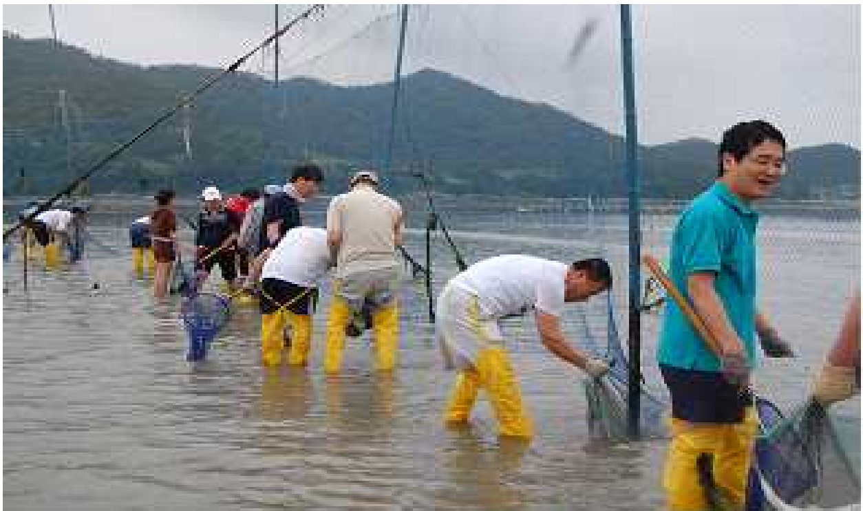
전남 진도 죽림 어촌체험마을 : 체험객들이 개막이체험(밀물에 그물을 세로로 세워 물이 빠져나갈 때 물고기는 못 빠져나가게 하는 어법으로 갇힌 수산물을 맨손이나 기구 등으로 잡는 체험)