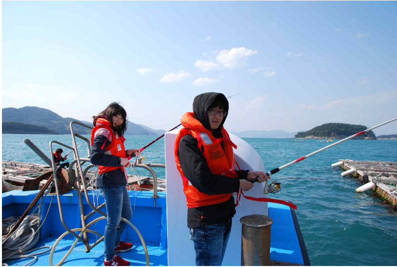
전남 여수 안도어촌체험마을 _ 선상낚시를 즐기는 체험객