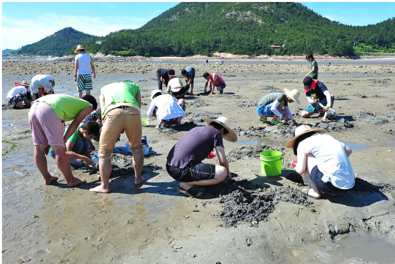
전북 군산 선유도어촌체험마을 _ 고은 모래펄에서 맛조개와 백합을 잡는 체험객