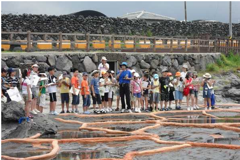
제주 구엄어촌체험마을 _ 돌염전에서 소금이 만들어지는 과정을 체험하는 학생들