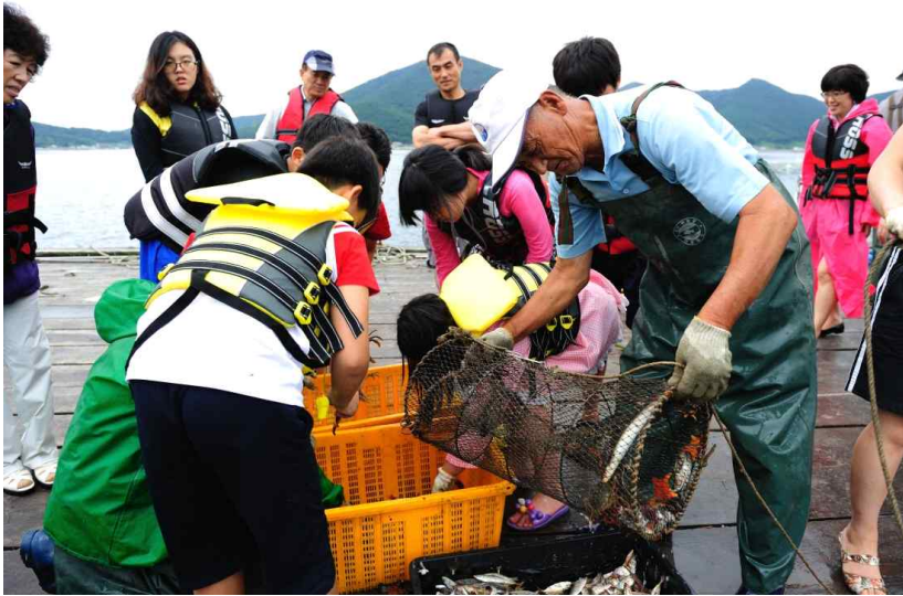
경남 거제시 쌍근어촌체험마을 _ 통발에 잡힌 물고기를 보고 있는 아이들