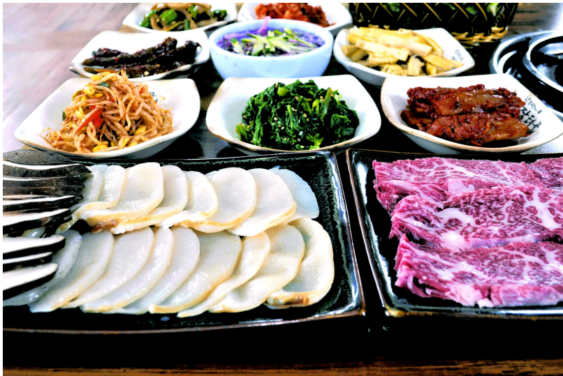
전남 장흥 수문어촌체험마을 _ 수문마을의 대표 음식인 키조개 삼합