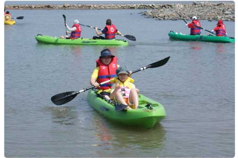
경기 화성 백미리어촌체험마을 _ 마을앞바다 카약체험장에서 카약을 타는 가족