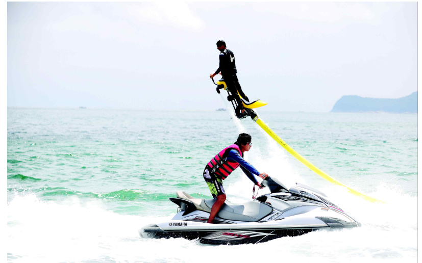
경남 남해 은점어촌체험마을 _ 수상레저체험(제트베이터)를 즐기는 체험객의 모습