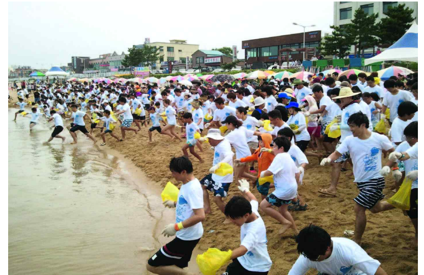
강원 속초 장사어촌체험마을 _ 오징어축제기간에 오징어맨손잡이 체험을 즐기는 모습