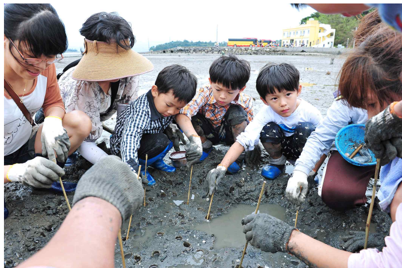
경남 남해 문향어촌체험마을 _ 붓에 된장을 묻혀 살살 흔들면 속이 잡히는 체험