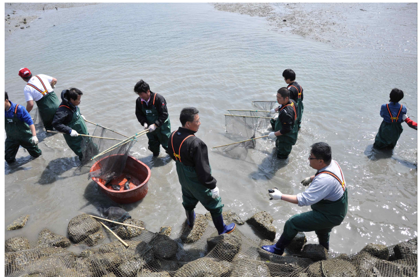
충남 태안 대야도어촌체험마을 _ 물이 빠진 독살에 남아 있는 우럭을 잡는 체험객