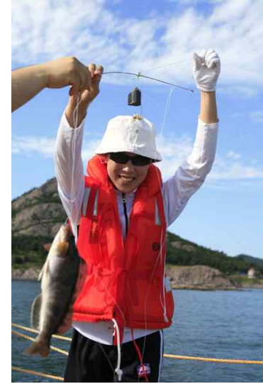
전북 군산 장자도어촌체험마을 _ 어장에서 물고기를 잡고 즐거워하는 체험객