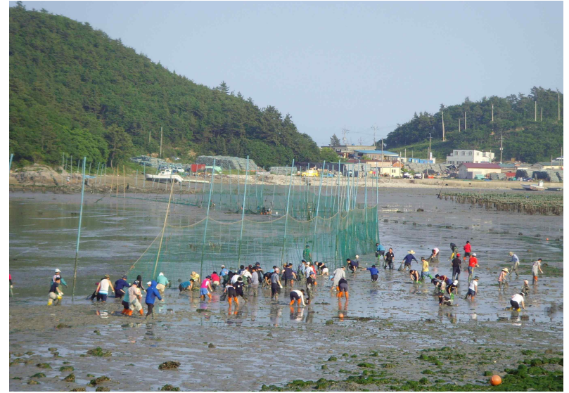
전남 진도 접도어촌체험마을 _ 썰물 때 그물에 걸려 못빠져나간 물고기를 잡는 개막이 체험을 즐기는 체험객