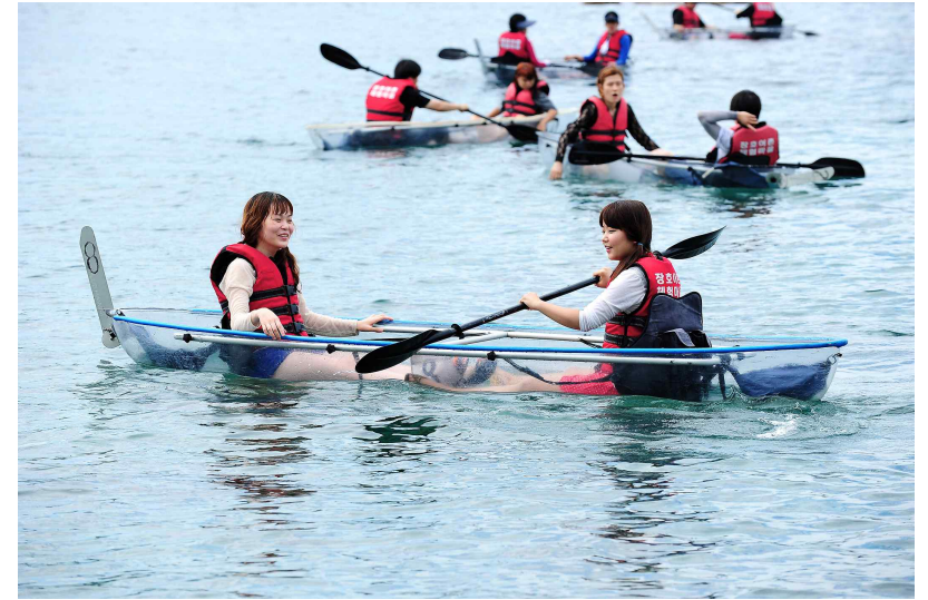
강원 삼척시 장호어촌체험마을 _ 투명카누를 즐기고 있는 체험객의 모습