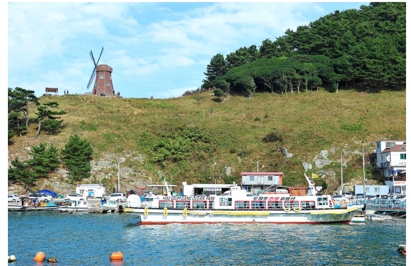
경남 거제시 도장포어촌체험마을 _ 바람의 언덕과 마을에서 운영하는 유람선 모습