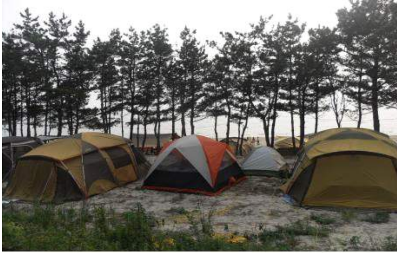
충남 태안 병술만어촌체험마을 _ 마을 해송림 캠핑장 모습(장비일체 대여가능)