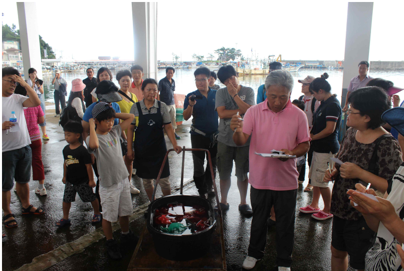
강원 양양 남애어촌체험마을 _ 남애항위판장에서 경매에 참여하고 있는 체험객