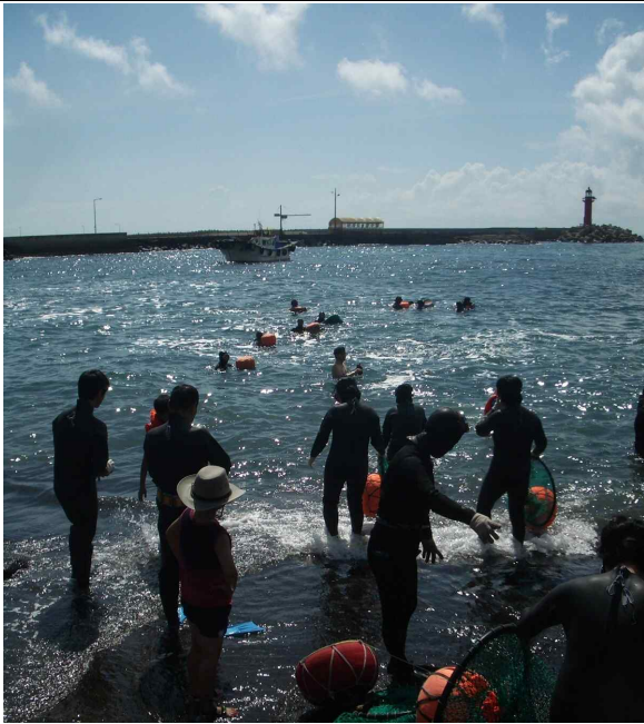
제주 서귀포 사계어촌체험마을 _ 1일 해녀가 되어보는 체험을 하는 체험객