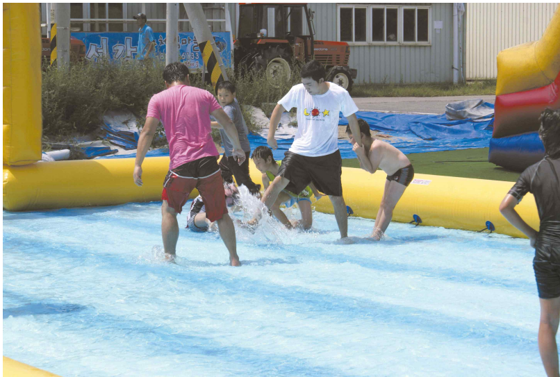
경기 안산 선감어촌체험마을 _ 에어바운스물놀이장에서 물놀이를 하는 모습