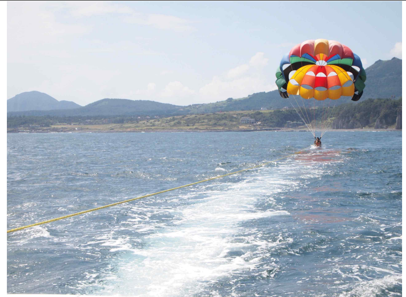
제주 서귀포 중문어촌체험마을 _ 페리세일링을 즐기는 체험객의 모습